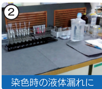
染色時の液体漏れに