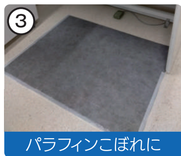
パラフィンこぼれに